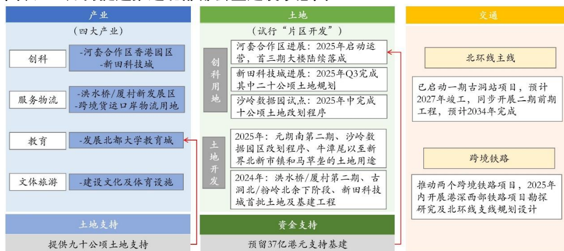
图表 2：如何提速推进北部都会区建设示意图